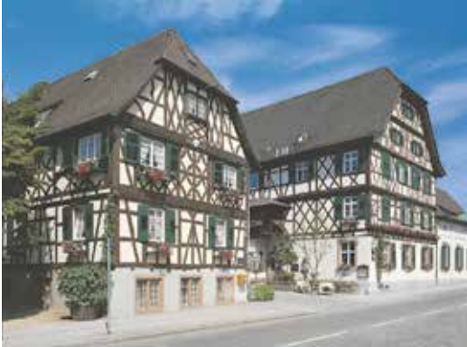
Hotel Obere Linde

Wirkungsstätte von Hans Jacob Christoffel von Grimmelshausen, der hier seinen „Simplicissimus“ schrieb.